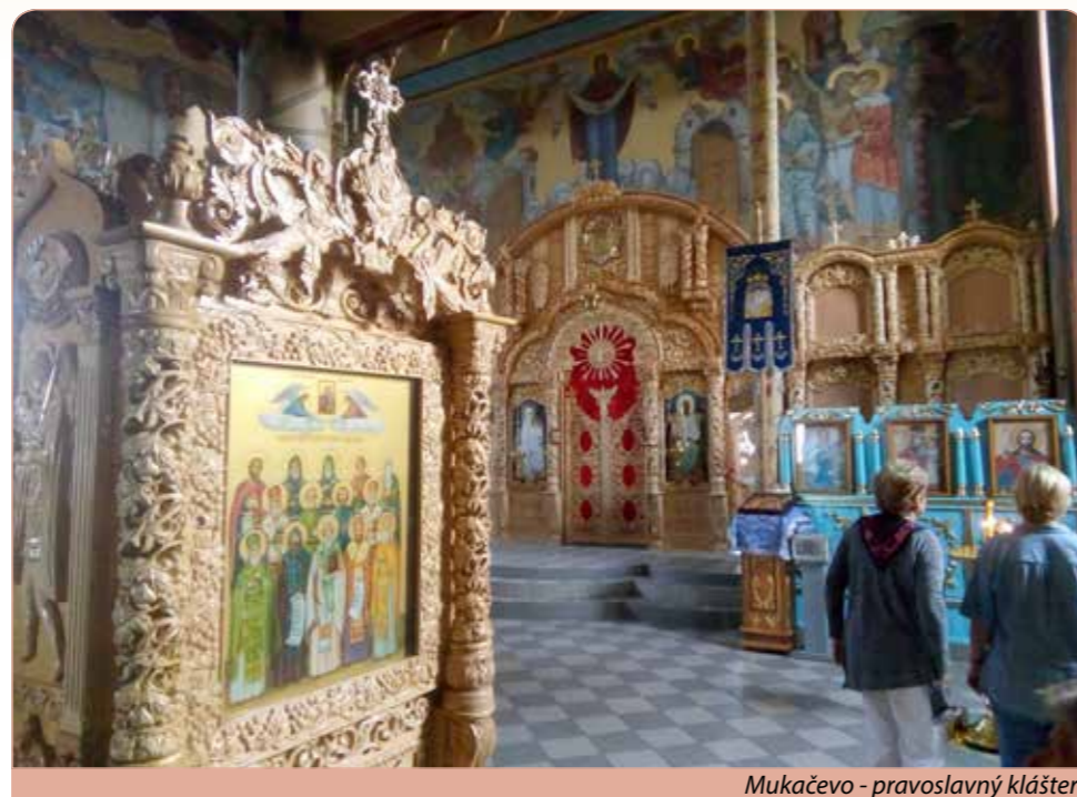
Mukačevo - pravoslavný klášter