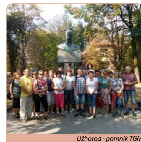
Užhorod - pomník TGM

Snídaně v hotelu. Odjezd do Užhorodu, významné metropole Podkarpatské Rusi a hlavního města Zakarpatské oblasti. Procházka v historickém centru s pěší zónou se spoustou památek, opravených kostelů a katedrál. Polední pozornost. Možnost prohlídky rusinského skanzenu s dřevěnými stavbami z celého Zakarpatí nebo hradu s muzeem karpatské přírody. V podvečerních hodinách přesun na Slovensko, večeře v hotelu.