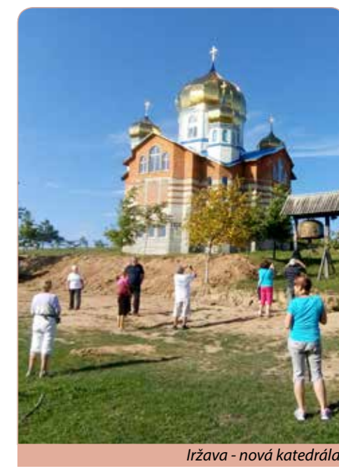
Iržava - nová katedrála