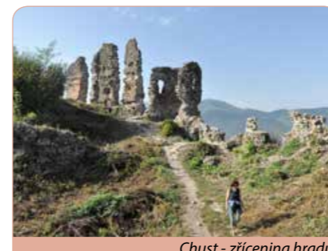
Chust - zřícenina hradu