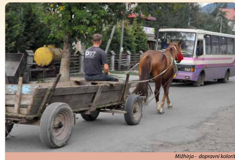
Mižhirja - dopravní kolorit

Snídaně v hotelu. Dopoledne návštěva Chustu, města na soutoku řek Riky a Tisy. Vycházka na sopečný kopec ke zřícenině středověkého hradu s výhledem na celé město. Ukázka starého gotického kostela sv. Elišky obehnaného opevněnou zdí. Zastávka u barokního paláce Perenyi ve Vynohradiv, jednoho z mála šlechtických sídel v Podkarpatské Rusi. Polední pozornost. Přejezd k prohlídce vinařského městečka Berehova, v minulosti největší vinařské oblasti Československa, které je dnes přirozeným kulturním centrem Maďarů na Ukrajině. Návrat na stejné ubytování, večeře v hotelu.