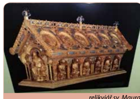
relikviář sv. Maura

městě lázeňského trojúhelníku. Procházka kolonádou s prvorepublikovou atmosférou a ochutnávka minerálních pramenů a ochutnávka minerálních pramenů, Zpívající fontána, sousolí Setkání monarchů. Ubytování a večeře v hotelu.