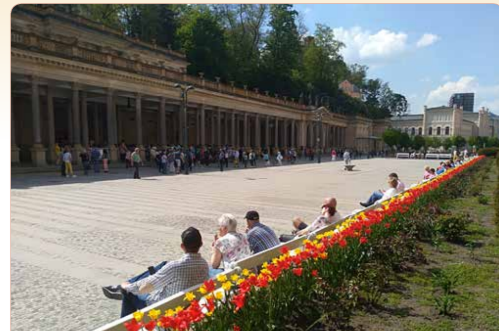
Karlovy Vary - lázeňská promenáda

nišť, slatiňšť a scenérií bahenních sopek s vývěry minerálních pramenů a oxidu uhličitého. Procházka naučnou stezkou vedenou po povalových chodnících. Dále pobyt ve Františkových Lázních se symbolem sochy Františka. Svět žluto-bílých lázeňských domů, vystavených v empírovém stylu, pramenů a kolonád roztroušených v moři parků. Návrat na stejné ubytování a večeře v hotelu.