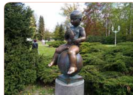
Františkovy Lázně - „František“

Snídaně v hotelu, dopoledne návštěva německého městečka Waldsassen s klášterem a katedrálou, jednoho z nejvýznamnějších kostelů Bavorska. Přesun do Chebu, prohlídka unikátního souboru bloku jedenácti měšťanských historických hrázděných domů Špalíček. Odpoledne rezervace Soos, s unikátní krajinou rašeli-