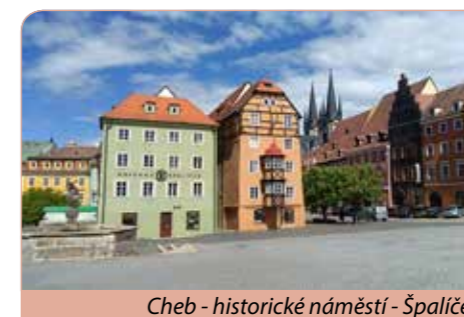
Cheb - historické náměstí - Špalíček