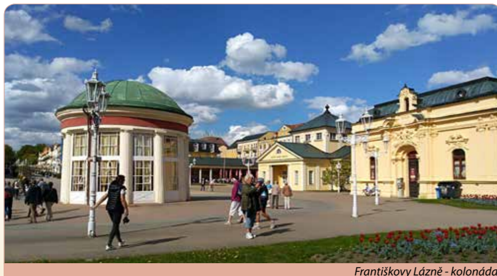
Františkovy Lázně - kolonáda