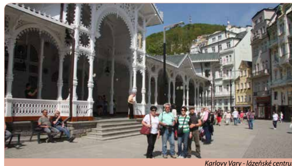
Karlovy Vary - lázeňské centrum

Snídaně v hotelu, odjezd k baroknímu zámku Kynžvart, přestavěného ve stylu vídeňského klasicismu a empíru. Prohlídka exteriéru s ochutnávkou lázeňského pramene. Zastávka u klášteru premonstrátů v Teplé s prohlídkou exteriérů. Dále Chyše, prohlídka interiéru zámku s expozicí věnované pobytu Karla Čapka v roce 1917. Odpoledne Valeč, barokní skvost na úpatí Doupovských hor. Procházka zámeckým parkem s kopiemi soch Matyáše Bernarda Brauna a jeho žáků. Večer příjezd do Prahy a Hradce Králové.