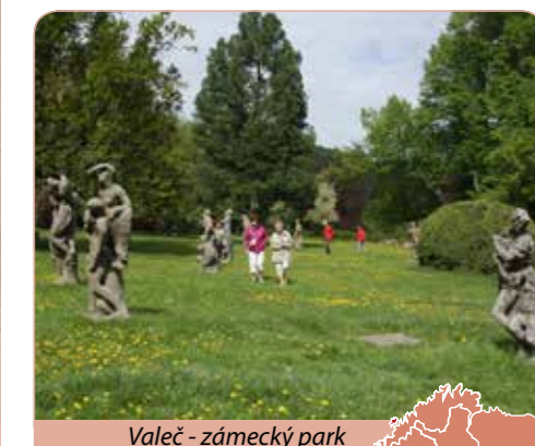
Valeč - zámecký park