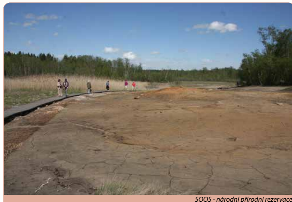
SOOS - národní přírodní rezervace

městě lázeňského trojúhelníku. Procházka kolonádou s prvorepublikovou atmosférou a ochutnávka minerálních pramenů a ochutnávka minerálních pramenů, Zpívající fontána, sousolí Setkání monarchů. Ubytování a večeře v hotelu.