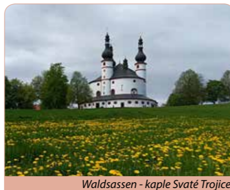
Waldsassen - kaple Svaté Trojice